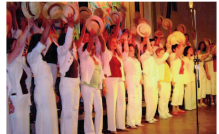
Der „Junge Chor“

Kinderchor erstellt. Phänomenal wurde das 50-jährige Bestehen der Liederkranzhalle mit einem tollen Opernkonzert