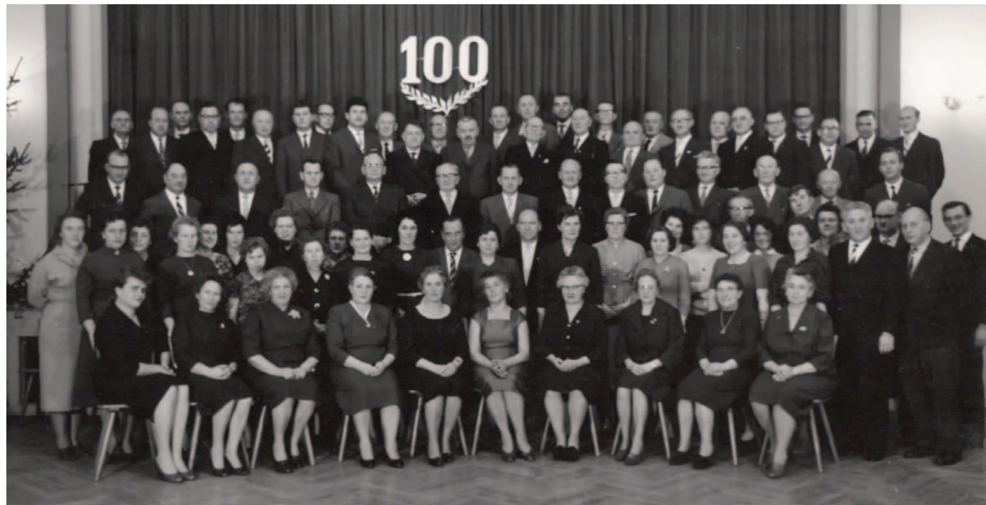
Jubiläum 100 Jahre