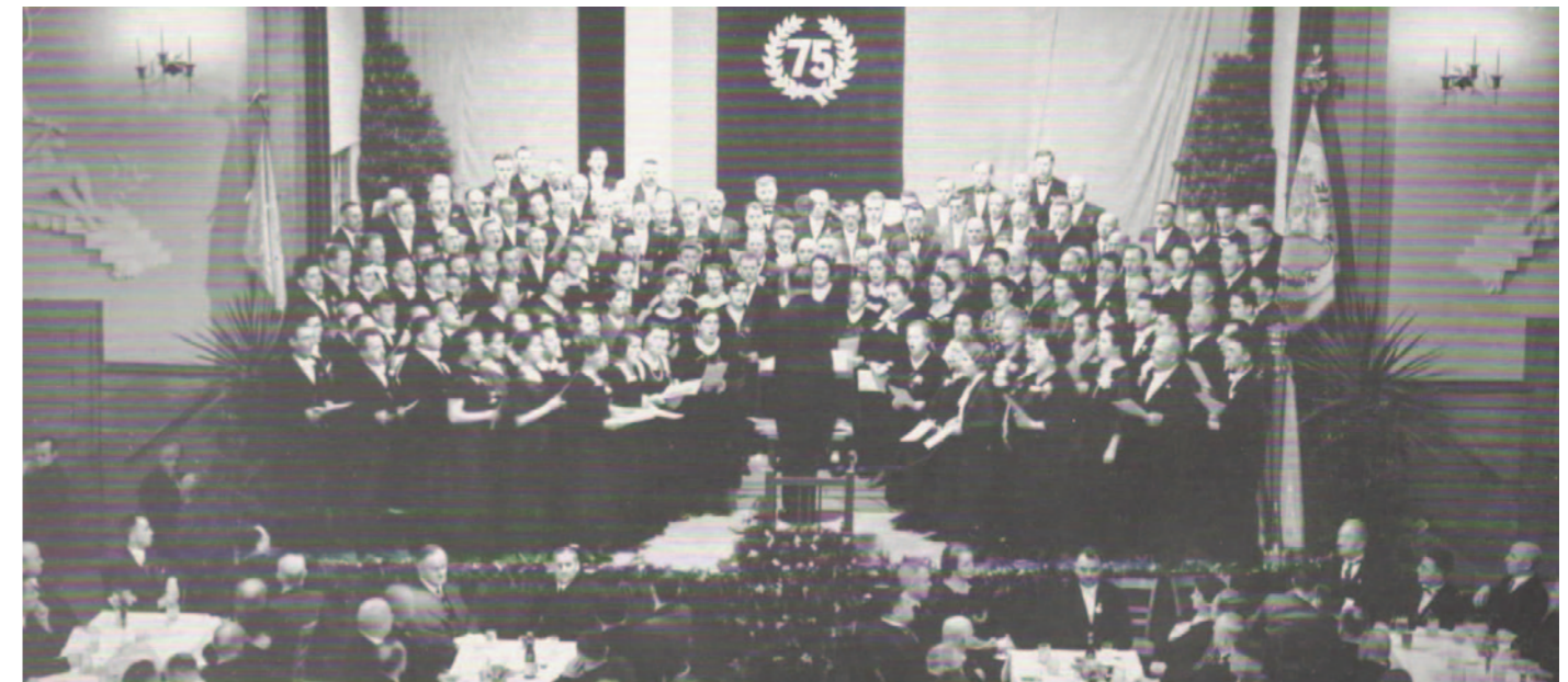
75 Jahre Jubiläum

1928 wurden zuerst der Knabenchor (kurz „Harmonjet“ genannt), danach die „dramatische Abteilung (Theatergruppe)“ und im Jahr 1930 dann endlich offiziell ein Frauenchor gegründet.