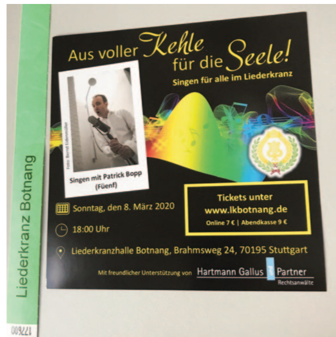
Aus voller Kehle für die Seele!