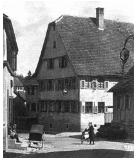
Gasthaus zum Hirsch

Friedrich Vogel zunächst im „Gasthaus zum Hirsch“, dann im „Gasthaus zur Sonne“ zu Gesangsübungen und „zum Trunke“ zusammenfanden. Botnang zählte damals rund 1.500 Einwohner und war noch eine selbstständige Gemeinde. Der junge Verein verzeichnete – wie bei anderen Männer-