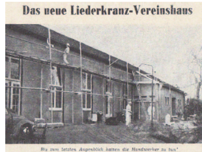
Das neue Liederkranz-Vereinshaus

Trotz aller Widrigkeiten und aufgrund der großzügigen Spenden konnte ab März 1953 weiter gebaut werden. Mit einem großen Festakt wurde die heutige Liederkranzhalle am 5. Dezember 1953 feierlich eingeweiht. Der damalige Oberbürgermeister Arnulf Klett nahm die feierliche Einweihung vor, die Halle selbst wurde geweiht. In der Einladung zur Einweihung stand geschrieben, dass „keine Bewirtschaftung stattfinden könne und es gebeten wurde, das Rauchen zu unterlassen“.