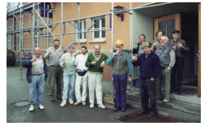
Renovierung der Halle

Baumaßnahmen wurden genutzt, um auch die Dachhaut selbst zu erneuern. Viele tausende Dachziegel wurden in Eigenleistung auf der Seite zur Lortzingstraße abgetragen und dadurch die Veranstaltungsräume gesichert. Um das Thema Nachhaltigkeit aufzugreifen, wurde die Dachseite mit 68 Solarmodulen bestückt. Ein großer Speicher sorgt dafür, dass fast