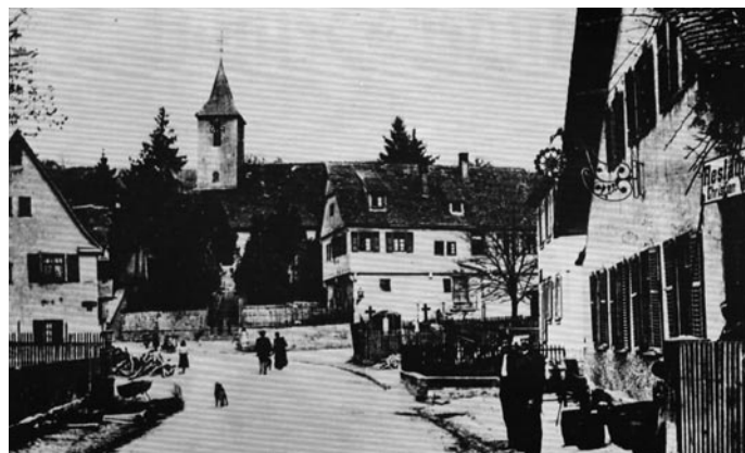
Gasthaus zur Sonne

gesangsvereinen auch – rasch einen starken Zuwachs und hatte bald 70 Mitglieder. Schon am 24. August 1862 konnte der Liederkranz seine