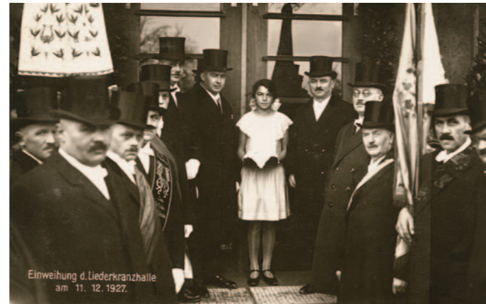
Einweihung der Liederkranzhalle am 11.12.1927

Das Fehlen eines eigenen Fest- und Probensaals führte Mitte der zwanziger Jahre dann zur Suche nach einer eigenen Liegenschaft. Bei der damaligen Schulwiese kaufte der Liederkranz ein 34 Ar großes Grundstück für 38.000 Reichsmark, das mit einem Kinderfest eingeweiht wurde. Der Bau einer eigenen Sängerkirche nahm danach konkrete Formen an.